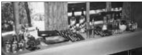
Gabentisch wie in alten Zeiten, also mit Maxvit-Racletteöfen