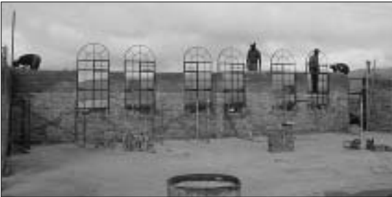
Die Kirche Nr. 17 von Skull im Rohbau, in der jetzt das Altarbild steht.

Am 17. Juli 2003 hat die NEUE OBERAARGAUER ZEITUNG in einem Bericht über das Bernische Kantonalgesangfest auf einer Bilderseite auch unseren Chor beim Auftritt in der Kirche abgebildet.