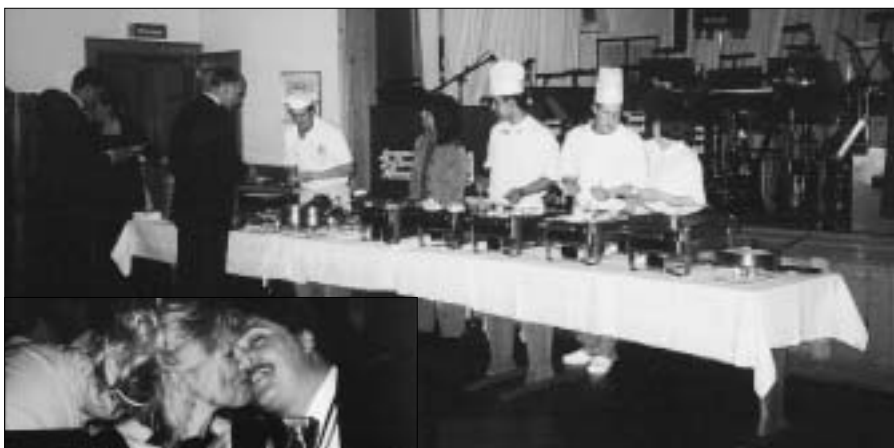
Am Büffet wurden alle Wünsche erfüllt