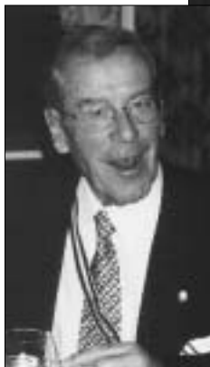
Es wurde auch gekantet, Salto und Aqua