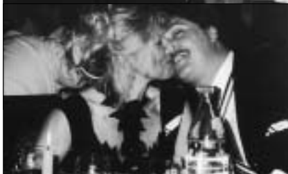
Astro mit Partnerin beim Tête à tête