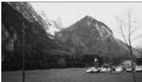
AH-Schiessen am Fusse des Stockhorns

unser bewährtes Schützenbüro hart arbeiten, so dass die Ehrenmeldungen und die Ranglisten rechtzeitig fertig wurden.