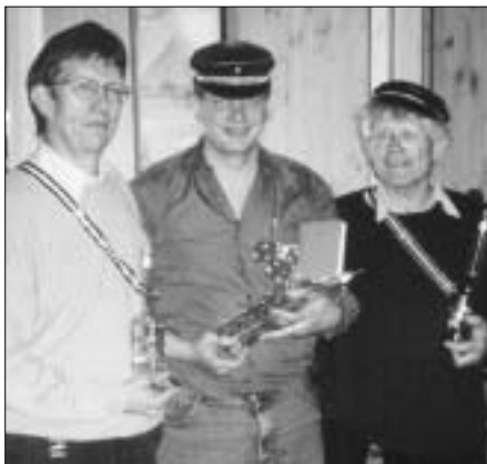
Die Sieger des AH-Stichs, 3. Kim, 1. Phantos, 2. Hämpu, vl.

Mit Farbengruss schwarz-weiss-schwarz Der Stamm Thun und seine Helfer