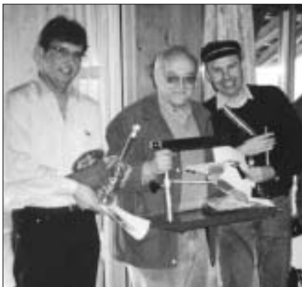
Die Sieger des GV-Stiches, 1. Beo, 4. Hamlet, 2. Hermes