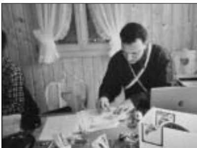
Die Schützen, das Rechnungsbüro (Triton) und viele Andere trugen zum Gelingen des Anlasses bei