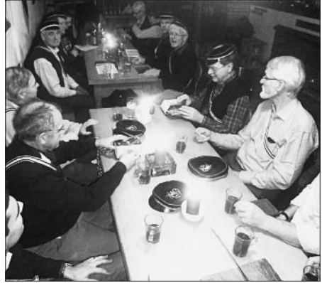
Die Corona beim Crambambuli