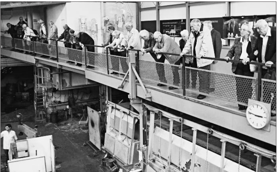
Es gab einiges zu sehen