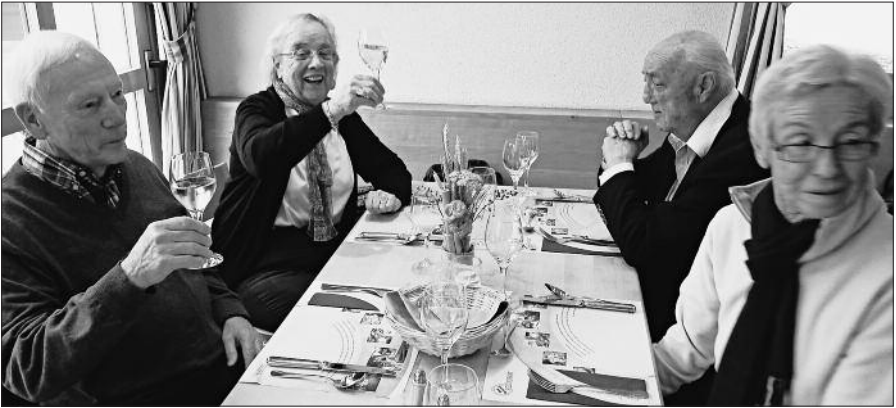
Im Adler herrscht gute Stimmung

diesem Durchgang erreicht man direkt die Glasproduktion rund um den Schmelzofen. Von hoher Warte aus war es eindrücklich zu schauen, wie die Arbeiter im Team bei grosser Hitze die verschiedenen Gegenstände formten. Frau Renggli von der Glasi beantwortete unsere Fragen sehr kompetent. Anschliessend konnte sich unsere Gruppe nach Belieben in der Glasi umsehen. Einzelne versuchten sich als Glasbläser, wobei erstaunlich schöne Glaskugeln entstanden. Andere wiederum frönten dem Shopping im Laden oder taten sich in der Caffè-Bar gemütlich.