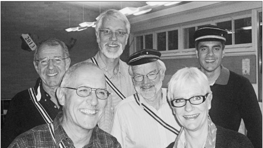
Die Brauer mit Schutzgöttin

Als der Crambambuli-Geist die Gewölbe und Gehirne der Mauern und Kommilitonen zu füllen begann, wussten wir: der Geist im alten Crambambuli hat seine