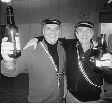
«Zwei Füchse» sind guter Laune