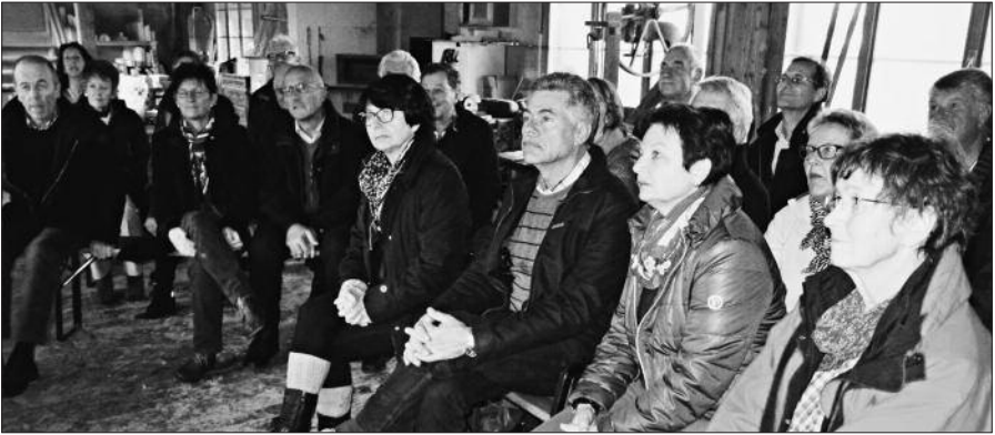
Eine interessierte Zuhörerschaft

gesehen haben. Das Feeling für das Holz, für die Wandstärken, die richtigen Längen für die verschiedenen Tonarten bis zum Finish mit Umwicklung, Ölung und Lackierung erreicht man wohl nur durch jahrelange Erfahrung. Für uns, in unserem automatisierten Zeitalter war es eine wohltuende Abwechslung. Siehe auch Filmli unter www.alphornmacherei.ch . Als Alphornkandidaten versuchten sich anschliessend mit Applaus Gefi und Pfizli.