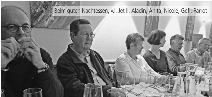
Beim guten Nachtessen, v.l. Jet II, Aladin, Anita, Nicole, Gefi, Parrot

Es gäbe noch viel zu berichten, über den technisch hochstehenden Schienenaufbau, das Signalisationssystem oder den politischen Fehlentschied, den Basistunnel vorerst nur einspurig fertig zu stellen. Aber ich will Sie nicht langweilen. Besuchen Sie doch das grossartige Bauwerk einmal selber. Es gibt an verschiedenen Tagen sog. Kombiführungen für Einzelpersonen. Infos und Anmeldung über: besucherwesen@bls.ch , oder Tel. Nr. 058 327 28 07.