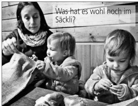
Was hat es wohl noch im Säckli?