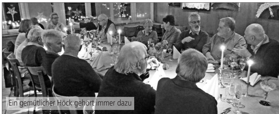
Ein gemütlicher Höck gehört immer dazu