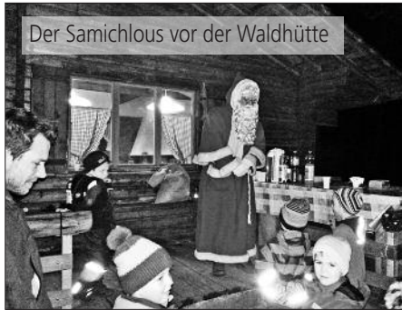
Der Samichlous vor der Waldhütte

Impressionen von der Waldweihnacht und der GV-Weihnachten