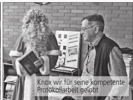
Knox wir für seine kompetente Protokollarbeit gelobt