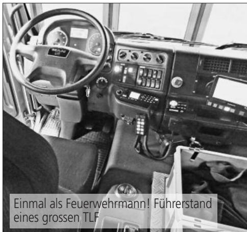
Einmal als Feuerwehrmann! Führerstand eines grossen TLF