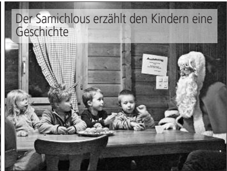
Der Samichlous erzählt den Kindern eine Geschichte