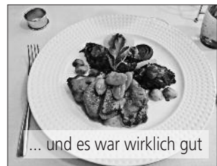
... und es war wirklich gut

Nachdem wir das Tunnelsystem wieder verlassen hatten, war die Dämmerung bereits fortgeschritten und in Frutigen war es eigentlich Nacht. Helm und Leuchtweste deponieren und auf zu neuen Taten! Parrot führte uns durch das nächtliche Frutigen zum Hotel National, wo wir in einem angenehmen Saal zuerst einen Apéro kredenzt bekamen, noblerweise von der Stammkasse über-