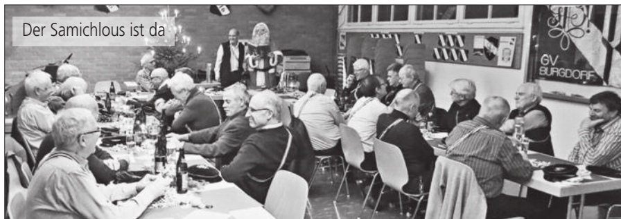
Der Samichlous ist da