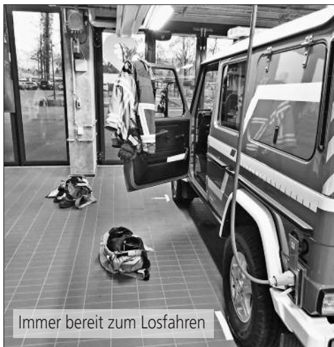
Immer bereit zum Losfahren

Übungen war ich dabei. Aber in ein TLF und dann noch in ein grosses durfte ich nie sitzen. Aber hier habe ich es geschafft! Aber, fahren mit einem Tanklöschfahrzeug müsste ich natürlich zuerst lernen.