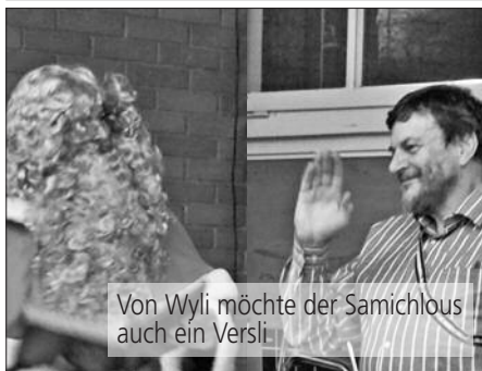
Von Wyli möchte der Samichlous auch ein Versli