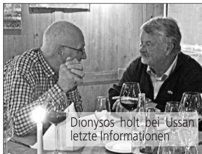
Dionysos holt bei Ussan letzte Informationen

Übungen war ich dabei. Aber in ein TLF und dann noch in ein grosses durfte ich nie sitzen. Aber hier habe ich es geschafft! Aber, fahren mit einem Tanklöschfahrzeug müsste ich natürlich zuerst lernen.