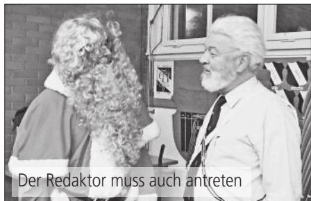
Der Redaktor muss auch antreten